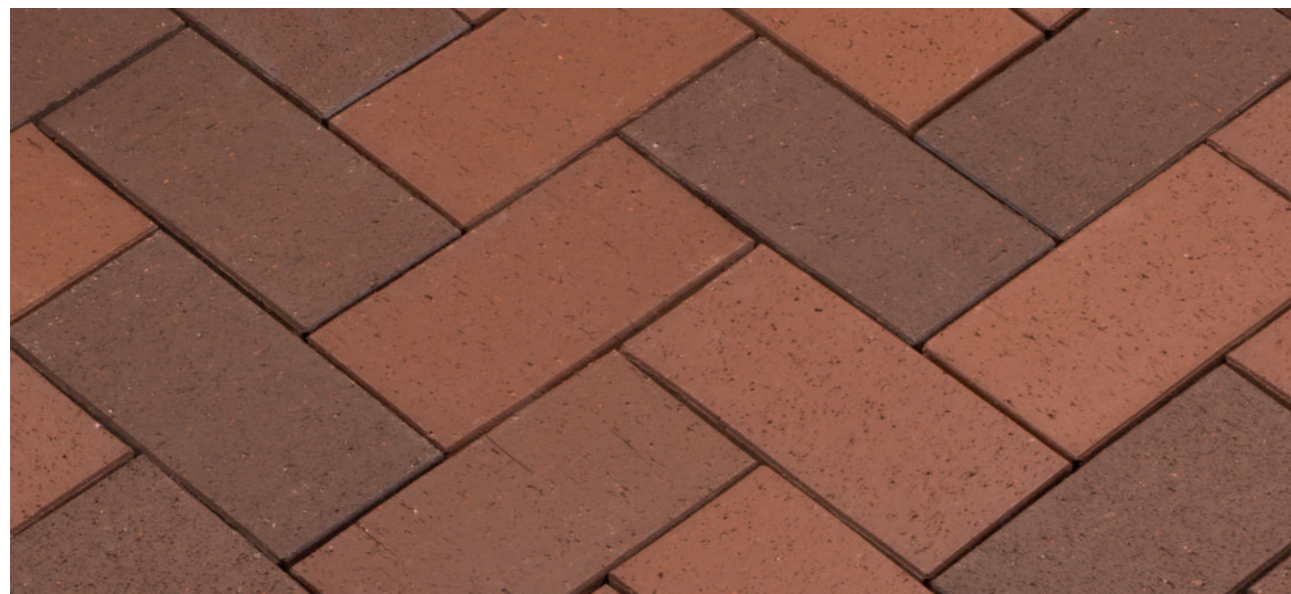
Baltic Nuance – Терракотовый