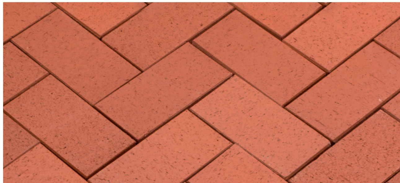
Baltic Classic – Красный