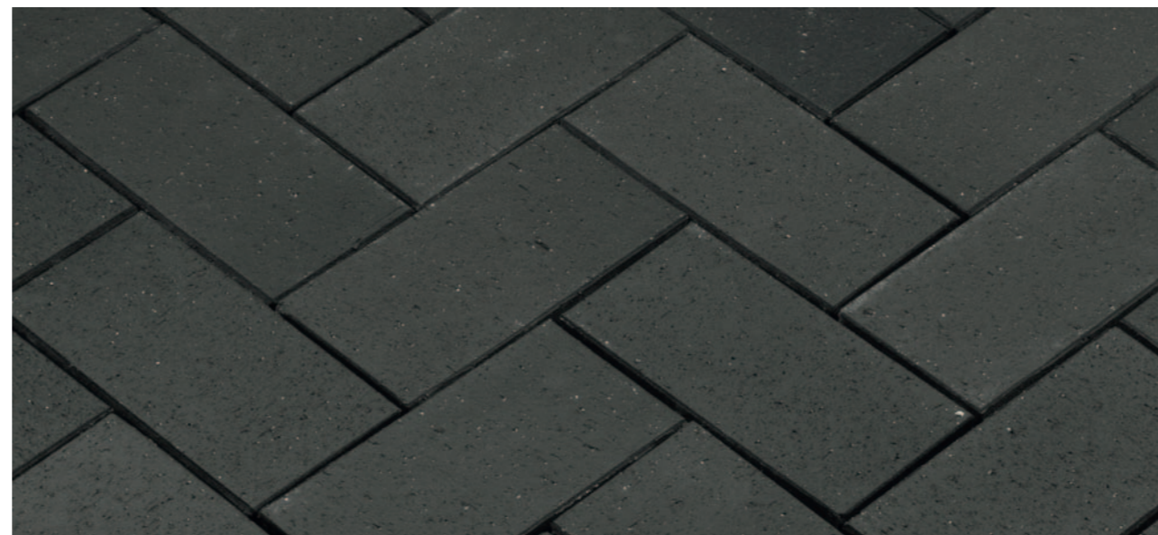
Baltic Grafit – Черный