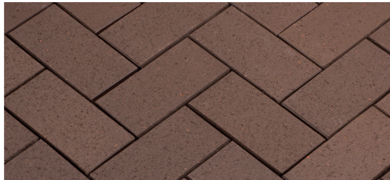
Baltic Braun – Коричневый